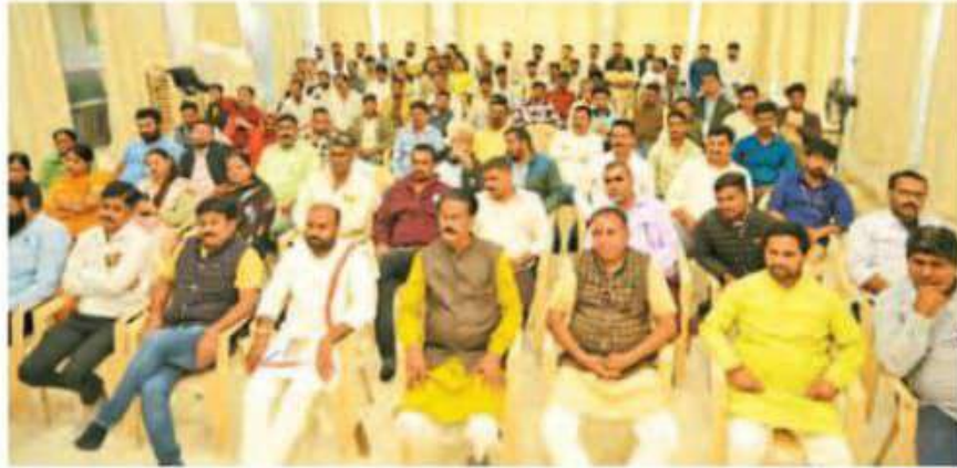
आबूरोड. कार्यशाला में मौजूद भाजपा कार्यकर्ता।